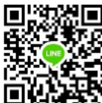
ลงทะเบียนสัมภาษณ์ทาง Google Meet

๔. หากผู้เข้ารับการสัมภาษณ์ไม่ได้ลงทะเบียนแจ้งความประสงค์ฯ ตามวัน เวลา ดังกล่าว สำนักงานเขตพื้นที่การศึกษามัธยมศึกษาพัทลุง จะถือว่าผู้เข้ารับการสัมภาษณ์ฯ มีความประสงค์เข้ารับ การสัมภาษณ์ด้วยตนเอง ณ ห้องประชุมชั้น ๒ สำนักงานเขตพื้นที่การศึกษามัธยมศึกษาพัทลุง